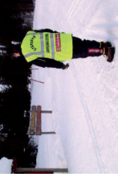
Spårvärdar informerar och hjälper till